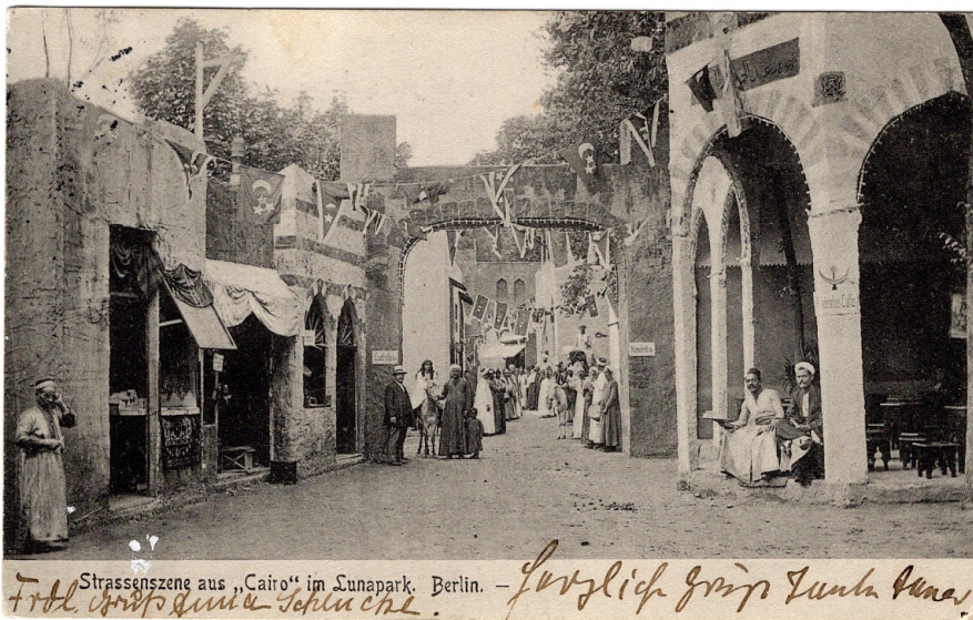
Eine vom Lunapark vertriebene Ansichtskarte zeigt die Kulissenstadt Straße von Kairo sowie einige der darin ausgestellten Menschen, Berlin 1911, Ansichtskarte, Archiv Museum Charlottenburg-Wilmersdorf.

Für die ausgestellten Menschen waren die Schauen harte Arbeit unter ungewohnten Bedingungen mit festem Terminplan und unter ständiger Observation einer gaffenden Öffentlichkeit. Im Publikum jedoch setzten sich die rassistischen Bilder fest, sie gehörten zur alltäglichen Vergnügungskultur dazu wie Würstchenbuden oder Blasmusik. Das abschließende Zitat aus einem Zeitungsartikel zur Straße von Kairo illustriert die beiläufige Selbstverständlichkeit, mit der »Völkerschauen« das Bild der „Anderen“ prägten: „Und zwischen Kaffee und Abendbrot genießt hier der Berliner die Wunder des Orients.“ [36]