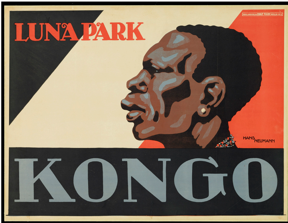
Mit diesem Plakat warb der Berliner Lunapark für seine Kongo-»Völkerschau«, Berlin 1912, Veranstaltungsplakat, Druckgraphik, Hans Neumann, bpk / Deutsches Historisches Museum / Sebastian Ahlers.